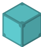
Σχήμα 2.3: IPFS logo

Το IPFS (InterPlanetary File System) είναι ένα P2P πρωτόκολλο υπερμέσων, σχεδιασμένο για να διατηρήσει και να αυξήσει τη γνώση της ανθρωπότητας κάνοντας το διαδίκτυο αναβαθμισμένο, ανθεκτικό και πιο ανοιχτό. Πρακτικά πρόκειται για ένα κατακεντρωμένο σύστημα για αποθήκευση και πρόσβαση σε αρχεία, ιστότοπους, εφαρμογές και δεδομένα. Το περιεχόμενο είναι προσβάσιμο μέσω ενός δικτύου ομότιμων κόμβων που βρίσκονται οπουδήποτε στον κόσμο, οι οποίοι ενδέχεται να μεταφέρουν πληροφορία, να την αποθηκεύσουν ή και τα δύο.