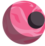
Σχήμα 2.3: OrbitDB logo

Η OrbitDB είναι μία P2P βάση δεδομένων ανοιχτού κώδικα. Χρησιμοποιεί το IPFS για την αποθήκευση των δεδομένων και το IPFS Pubsub για τον αυτόματο συγχρονισμό των βάσεων δεδομένων μεταξύ των peers. Είναι μία τελικά συνεπής (eventually consistent) και χρησιμοποιεί CRDTs (Conflict-Free Replicated Data Types) για συγχωνεύσεις βάσεων δεδομένων χωρίς συγκρούσεις, πράγμα που την καθιστά εξαιρετική επιλογή για DApps και offline-first web applications.[1]