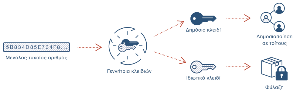
Σχήμα 2.1: Παραγωγή ασύμμετρου ζεύγους κλειδιών

Ο χρήστης μπορεί να χρησιμοποιήσει τα κλειδιά για δύο βασικούς σκοπούς: