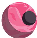
Σχήμα 2.6: OrbitDB logo

Η OrbitDB είναι μία P2P βάση δεδομένων ανοιχτού κώδικα. Χρησιμοποιεί το IPFS για την αποθήκευση των δεδομένων και το IPFS Pubsub για τον αυτόματο συγχρονισμό των βάσεων δεδομένων μεταξύ των peers. Είναι τελικά συνεπής (eventually consistent) και χρησιμοποιεί CRDTs (Conflict-Free Replicated Data Types) για συγχωνεύσεις βάσεων δεδομένων χωρίς συγκρούσεις, πράγμα που την καθιστά εξαιρετική επιλογή για DApps και offline-first web applications.[12]